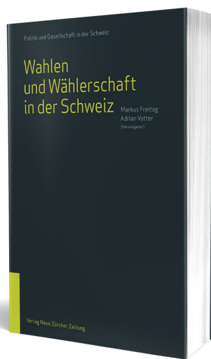
Markus Freitag, Adrian Vatter (Hrsg.), Wahlen und Wählerschaft in der Schweiz 480 S., 129 Abb., CHF 38.–

HERBERT AMMANN, SCHWEIZERISCHE ZEITSCHRIFT FÜR SOZIOLOGIE